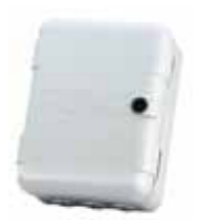
Contenedor mod. L para tarjetas electrónicas