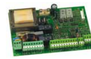
Tarjeta electrónica 455 D Caract. técnicas en la pág. 124