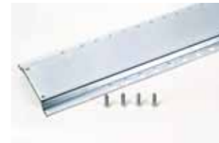
Larguero de fijación longitud 1,5 m