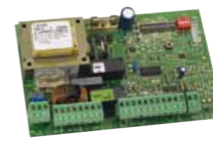
Tarjeta electrónica 452 MPS Caract. técnicas en la pág.121