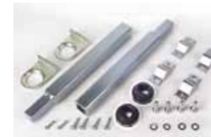
Par de tubos de transmisión con soportes laterales, para instalación con 1 o 2 actuadores

Código artículo (1 actuad.) 390434 Código artículo (2 actuad.) 390435