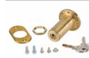
Desbloqueo externo con llave para puertas de 15 mm de espesor máx. (del n. 1 al n. 36)