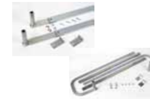
Paquetes con dos brazos telescópicos rectos o curvos

Código artículo (rectos) 390432 Código artículo (curvos) 390433