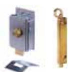
Otros accesorios pág. 148