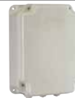
Contenedor mod. E para tarjetas electrónicas