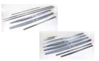
Paquetes para 1 o 2 actuadores con brazos telescópicos, largueros y tubos

Código artículo (1 actuad.) 390434 Código artículo (2 actuad.) 390435