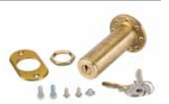
Desbloqueo externo con llave para puertas de más de 15 mm de espesor (del n. 1 al n. 36)