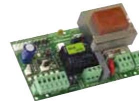
Tarjeta electrónica 596 BPR Caract. técnicas en la pág. 130