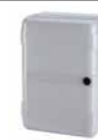
Contenedor mod. LM para tarjetas electrónicas