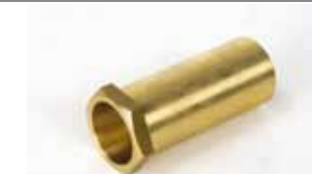
Prolongación desbloqueo externo para puertas con más de 15 mm de espesor