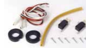
Kit instalación final de carrera apertura y cierre Código artículo 390567