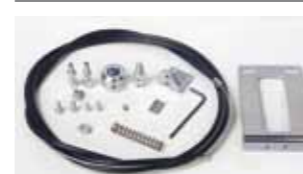
Desbloqueo externo para aplicación en manilla existente