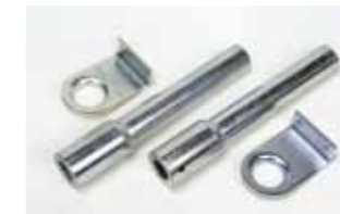
Par de tubos de transmisión, con soportes laterales, para instalac. con dos actuadores