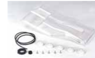
Kit para grado de protección IP 44 Código artículo 110554

Paquetes con dos brazos telescópicos rectos y curvos