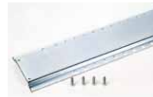
Larguero de fijación longitud 1.5 m

Código artículo (rectos) 6390563 Código artículo (curvos) 390564 Cód. art. (rectos con casquillo) 738709