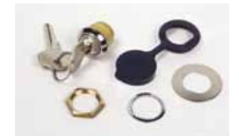
Desbloqueo externo con llaves personalizadas del n. 1 al n° 50