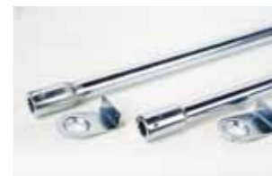
Par de tubos de transmisión (long. 1,5 m), con soportes laterales, para instalac. con un actuador central