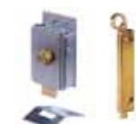
Otros accesorios pág. 148