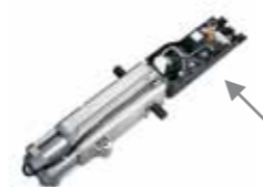
Tarjeta electrónica E550 Incorporada Caract. técnicas en la pág. 129