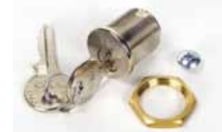
Cerradura de desbloqueo con llave personalizada del nº 1 al nº 36 Códigos del 712751 al 712786