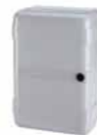
Contenedor mod. LM para tarjetas electrónicas Código artículo 720309