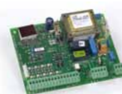
Tarjeta electrónica 578 D (instalación remota) Caract. técnicas en la pág. 126 Código artículo 790922