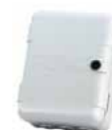
Contenedor mod. L para tarjetas electrónicas Código artículo 720118