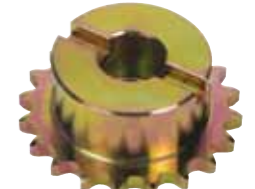
Piñón Z20 cadena Código artículo 719135