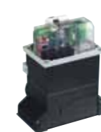
Tarjeta electrónica 780 D Caract. técnicas en la pág. 126