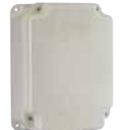
Contenedor mod. E para tarjetas electrónicas Código artículo 720119