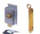
Otros accesorios pág. 148