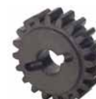
Piñón Z20 cremallera