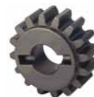
Piñón Z16 cremallera