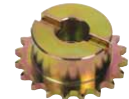
Piñón Z20 cadena