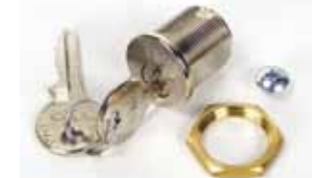
Cerradura de desbloqueo con llave personalizada del n° 1 al n° 36