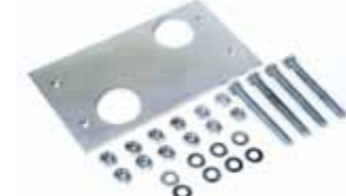
Placa de cimentación con regulaciones laterales y en altura (paq. de 6 pzas.)