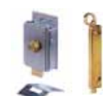
Otros accesorios pág. 148