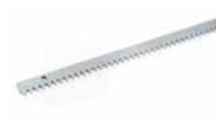
Cremallera y cadena Ver pág. 62