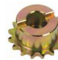
Piñón Z16 cadena