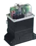
Tarjeta electrónica 780 D Caract. técnicas en la pág. 126